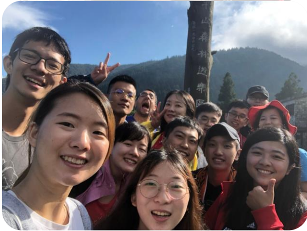
圖：太平山雨見天晴

在兩天一夜的旅程中，我覺得最棒的體驗是在崙埤聖德蘭天主堂彌撒的時候，十幾位夥伴坐在小小的教堂中，有人準備音響、有人準備輔祭、有人準備音樂與經文，感覺是所有的人一起完成了一台彌撒，也特別感受到這是一台為我們而做的彌撒。就像是這趟旅行之所以這麼美好，也是因為大家都願意為了彼此付出，有人規劃旅程、有人開車、有人準備音樂，就算遇到下雨、人擠人、餐廳座位不夠等等意外，大家也願意陪伴彼此，沒有人吐槽、抱怨，彷彿一起旅行就是唯一的目的。