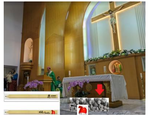
堂慶鉛筆可自由取用與致贈親友。 寫上寶貝羔羊暱稱的石頭，放置祭台前。

註 2：石頭放置祭台前，為建堂 70 周年諧音棄石、基石的紀念，祈禱意向的提醒。7/2 堂慶後，請自行領回。