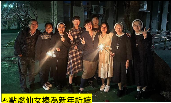
▲點燃仙女棒為新年祈禱