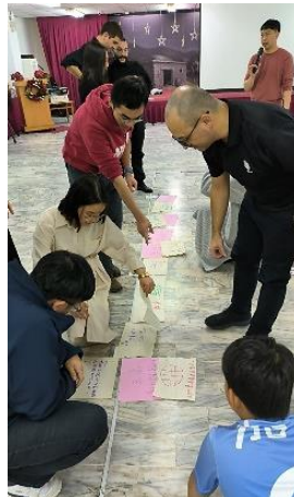
▲遊戲~寫下感恩的事 ▲跨年前五分鐘！倒數！