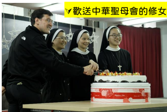
✓歡送中華聖母會的修女們