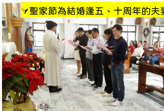
✓聖家節為結婚逢五、十周年的夫妻降福