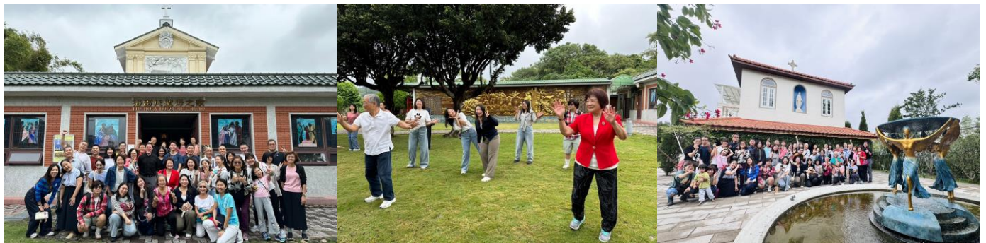
▲ 11/16 成人慕道班戶外共融~洛雷托聖母之家 & 峨眉十二寮天使教堂

我很珍惜與新莊堂的大家短暫相處的時光，也由衷地感謝大家在過去三個月裡的照顧，在新莊堂學習到的一切都將成為我慕道旅程的養分，也期待天主為我安排的路與新莊堂的大家再次相遇。